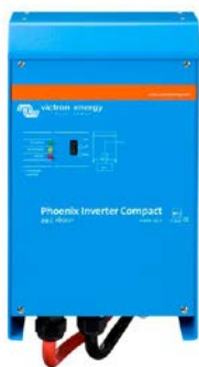
Phoenix Inverter Compact 24/1600

Les possibilités des convertisseurs puissants en parallèle sont réellement surprenantes. Pour en savoir plus sur les batteries, les configurations possibles et des exemples de systèmes complets, veuillez consulter notre livre « Energie Sans Limites » (disponible gratuitement chez Victron Energy et en téléchargement sur www.victronenergy.com ).