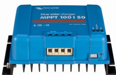
Contrôleur de charge solaire MPPT 100/50